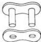
A Außenglied (Nietglied)